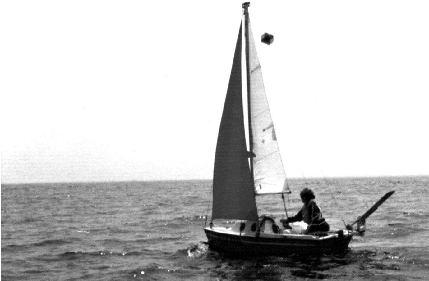
Afb. 2) Bas Jan Ader in de Ocean Wave, 1975. De foto is gebruikt in bulletin 89 van Art & Project: Bas Jan Ader. In search of the miraculous , juli 1975.