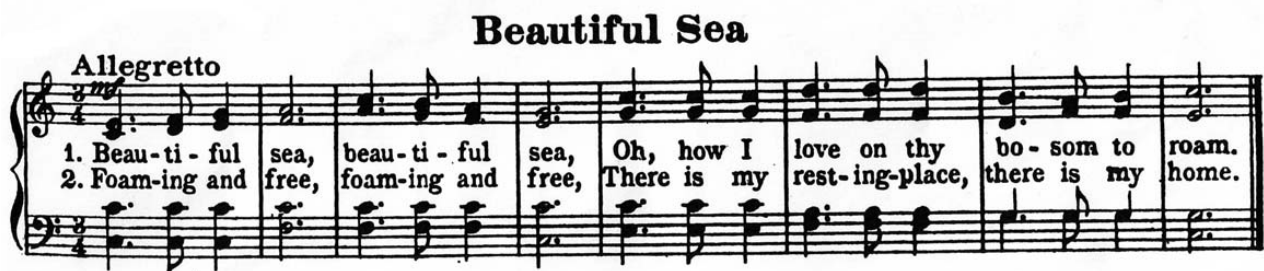
Afb. 1) Partituur Beautiful Sea .