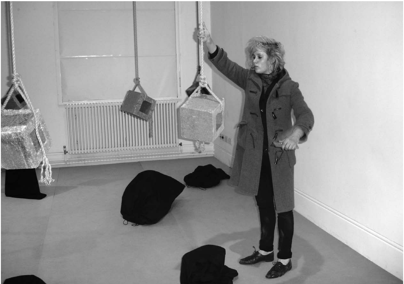
Afb. 4) Een van de studenten van de Ruskin School of Drawing and Fine Art in actie in de reprise van Bas Jan Aders tijdelijke installatie Light Vulnerable objects threatened by eight cement bricks , Camden Arts Centre, Londen, 17-21 mei 2006.

keer op keer onder de loep te nemen. Brokstukken van films, of kopieën van kopieën zijn te pas en te onpas als afzonderlijke kunstwerken gepresenteerd. (13)