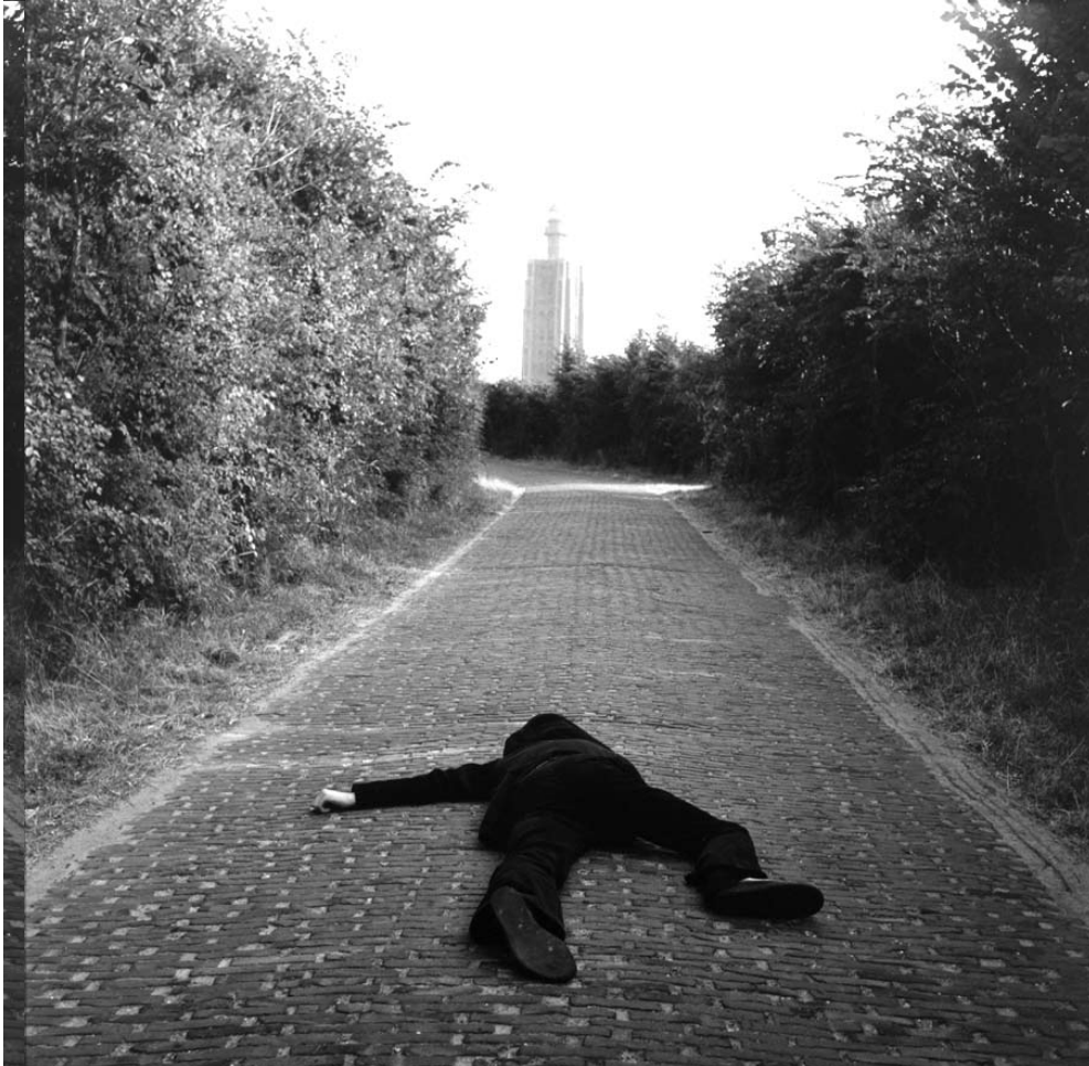
Afb. 3) On the road to a new plasticism, Westkapelle, Holland, 1971, Rotterdam, Museum Boijmans van Beuningen ®.